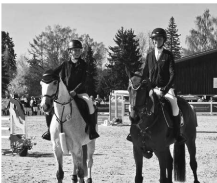
Unsere Youngsters erfolgreich im Turnierparcours unterwegs: wir gratulieren herzlichst!