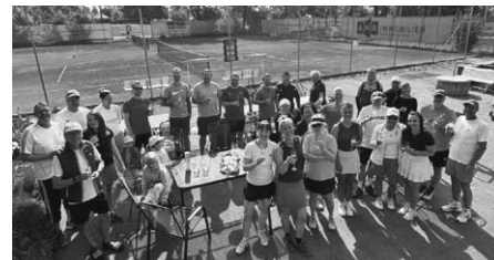
Teilnehmerfeld TCA Schleifchen-Turnier

Was für ein Start in den Tennissommer 2026! Wenn Petrus ein Tennisfan ist, trägt er dieses Jahr das TCA-Logo auf dem Trikot. Bei strahlendem Sonnenschein, weißblauem Himmel und sommerlichen Temperaturen wurde unsere Anlage am Sonntag zum Treffpunkt für alle, die Lust aufs Tennis-Spiel hatten.