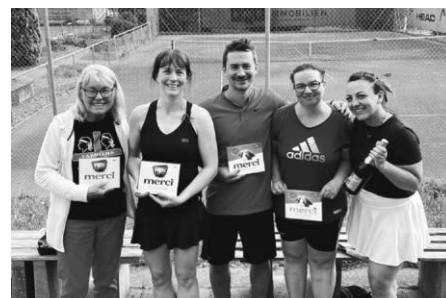
Die Schleifchen-Sieger 2026

Am Nachmittag standen die Gewinner fest: