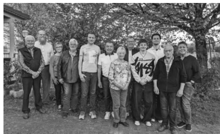
Ehrungen für langjährige Mitgliedschaft

Mit einem Ausblick auf kommende Termine wie die Maiwanderung und das „Sommer Fäscht“ endete die Versammlung.