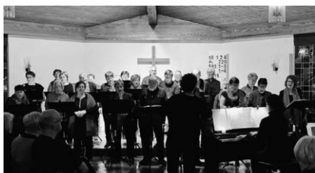
Chor KLANGVOLL beim Adventskonzert

Wir freuen uns auf Sie! Ihr Chor KLANGVOLL