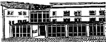
Seniorentreff Ailingen Bodenseestraße 16

Wir wünschen allen Jubilaren einen schönen Festtag und für die Zukunft alles Gute.