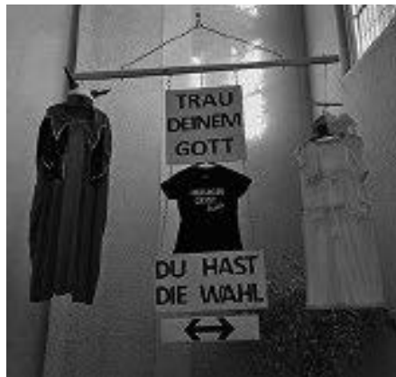
Liebe Ailingерinnen und Ailingер, die derzeitige Dekoration unserer St. Johanneskirche führte und führt offensichtlich zu der einen oder anderen Irritation. Daher hier ein paar Worte der Erläuterung: Was steht hinter dieser „Fasnetsdeko“ eigentlich genau das, was da geschrieben steht, ohne jeden Hintergedanken:

lich zu der einen oder anderen Irritation. Daher hier ein paar Worte der Erläuterung: Was steht hinter dieser „Fasnetsdeko“ eigentlich genau das, was da geschrieben steht, ohne jeden Hintergedanken: