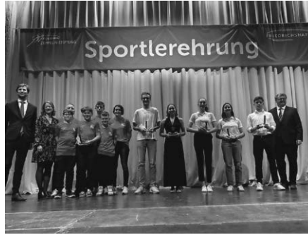
Sportlerehrung Stadt Friedrichshafen mit den Award-Winnern der Kategorie Sonderehrungen - und natürlich schließen wir uns herzlichst an mit unseren Glückwünschen!