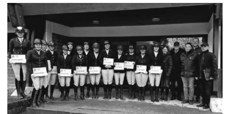
Und an dieser Stelle natürlich auch herzliche Glückwünsche vom RFV Ailingen an alle Prüflinge, die ihre Scheine erfolgreich in Marbach am Landesgestüt bestanden haben. Top!