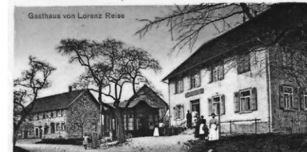
Gasthof „Zum Ochsen“ Ailingen

https://geschichtsverein-ailingen-berg.de